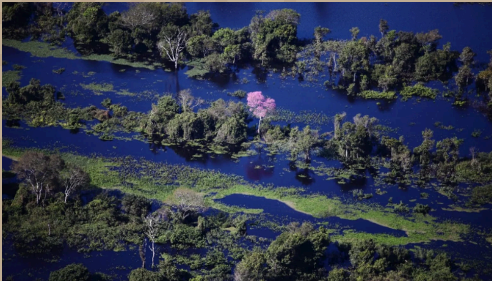
Acervo do Museu das Águas Brasileiras