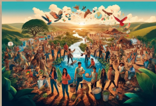
Museu das Aguas Brasileiras