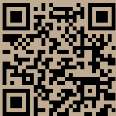
Museu das Águas Brasileiras

O Museu das Águas Brasileiras funciona como uma plataforma online ( https://museudasaguasbrasileiras.org ), é apoiado pela Rede Global de Museus da Água (WAMUNET/ https://www.watermuseums.net/ ), uma organização endossada pelo Programa Hidrológico Internacional da UNESCO. Com mais de 100 Museus da Água e membros institucionais em todo o mundo (com um público potencial superior a 12 milhões de visitantes por ano) (referência 2020). O Museu das Águas Brasileiras serve como um centro de preservação e divulgação de diversas conexões com a água e o patrimônio natural e cultural, seja ele tangível ou intangível. Também destaca a importância das técnicas ancestrais, legados e conhecimentos tradicionais na promoção de diferentes heranças e valores relacionados com a água, e apresenta exemplos de soluções baseadas na natureza e tecnologia de desperdício zero.