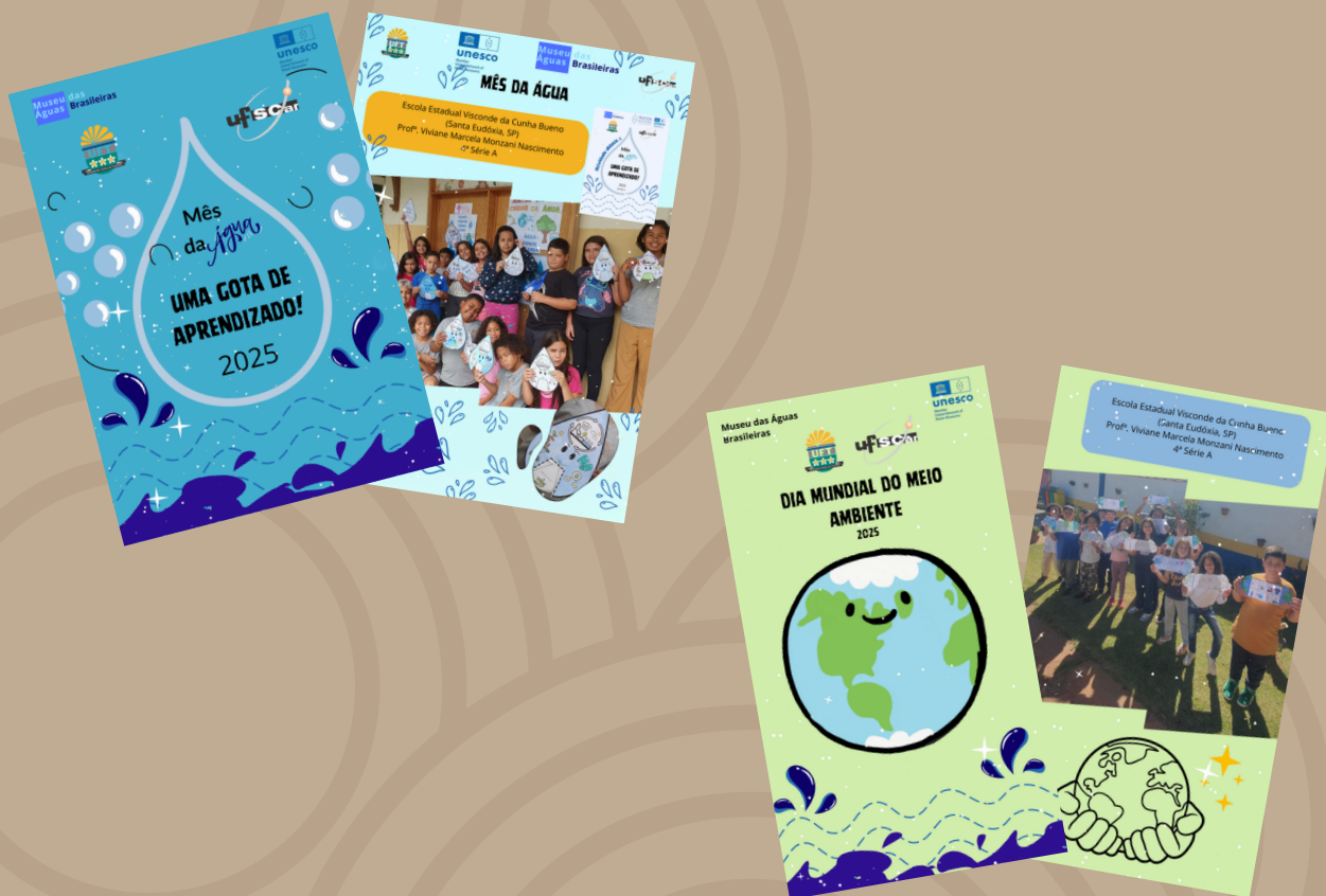
Museu das Águas Brasileiras