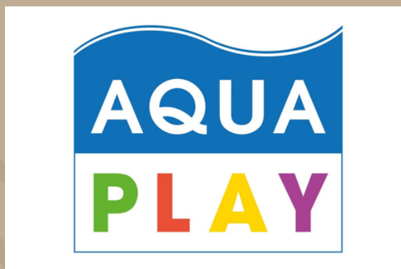
Museu das Águas Brasileiras